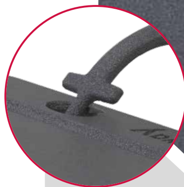
Dettaglio inserimento maniglia BBQ HANDLE

Piastra in ghisa. Ottima per cuocere in esterno ed interno.