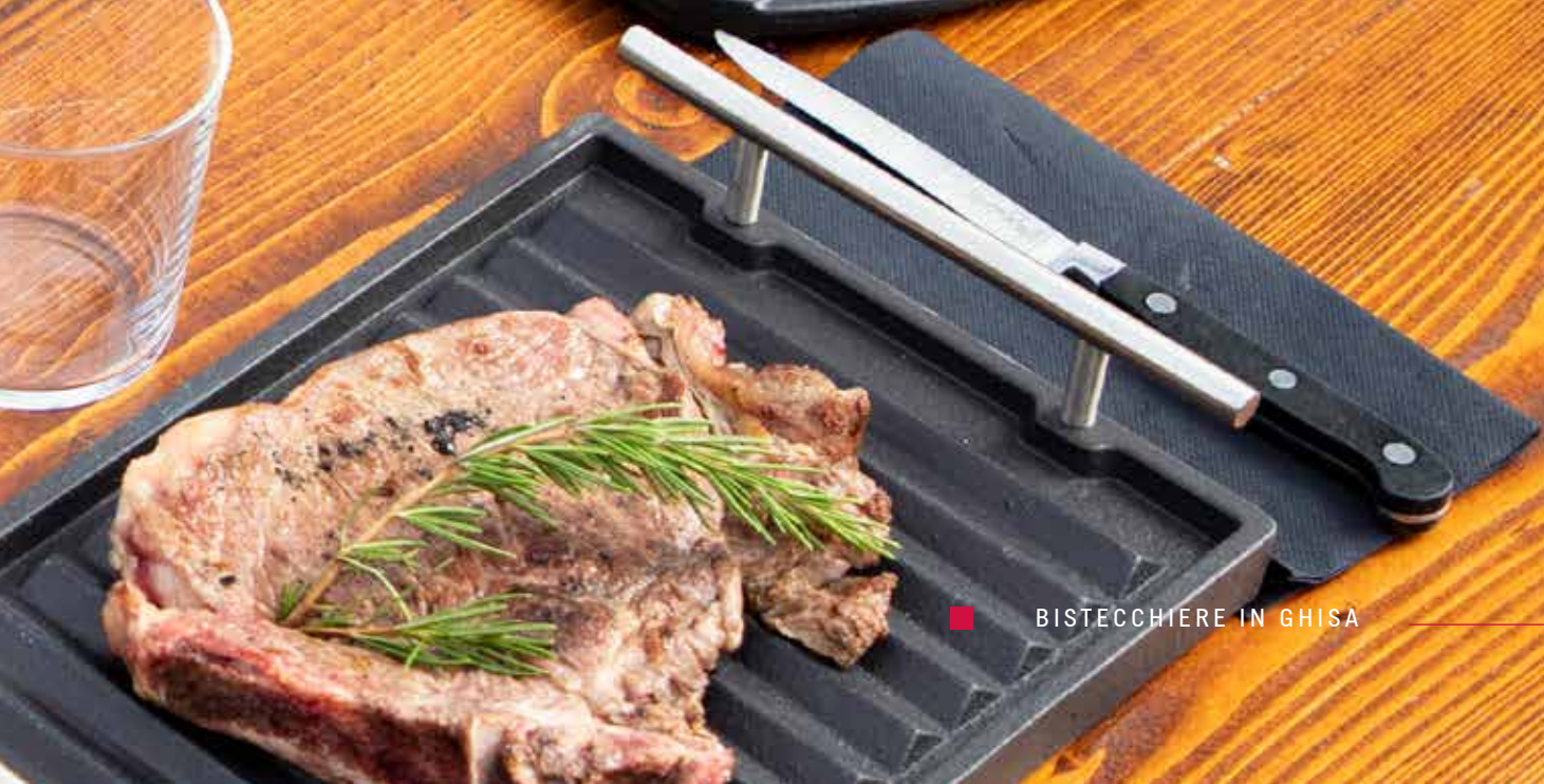
BISTECCHIERE IN GHISA